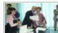
POZZALLO UNIVERSITA' DELLA TERZA ETA'