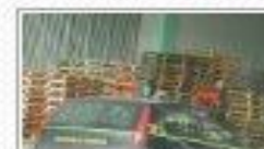
GUARDIA DI FINANZA SCOPERTI