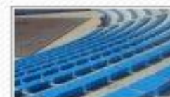
Pozzallo I vandali colpiscono ancora