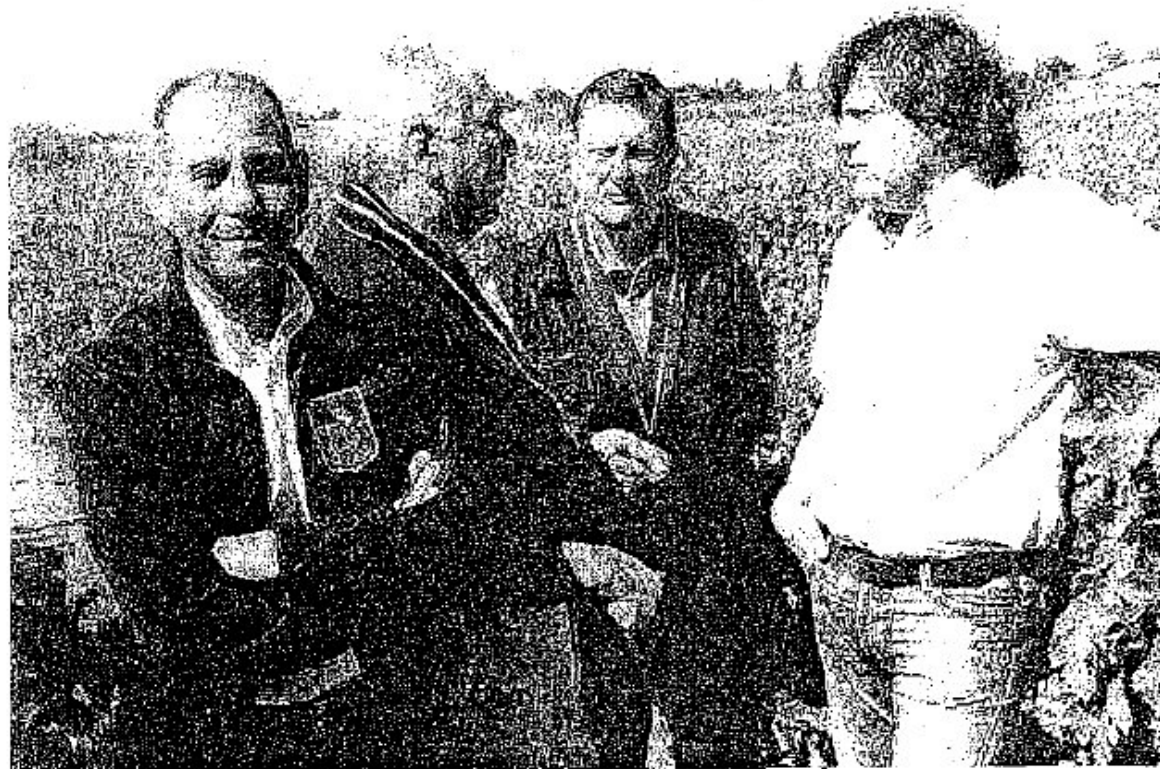
UN MOMENTO DELL'INCONTRO CON I CONFRATI DEL VINO E DELLA VITE