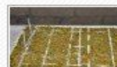
Appuntamento al 23 agosto